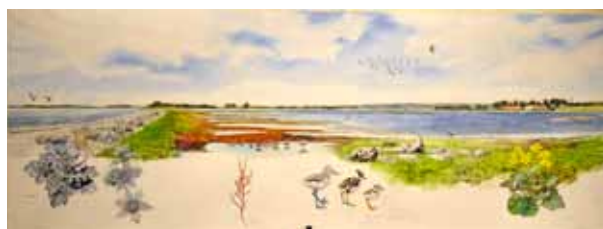
Bøjden Nor kystlagune, landskapsakvarell till naturtavle, 2012

En av Carl Christians stora danska uppdragsgivare är DOF, Dansk Ornitologisk Forening och Fugleværnsfonden. Genom åren har han bidragit med många hundra illustrationer till naturfolders, naturtavlor och tidskriftsillustrationer. Under förra året gjorde han bl.a. illustrationer till reservatet Bøjden Nor i förbindelse med EU LIFE projektet "genopretning af overdrev med positiv indflydelse på sårbar kystlagune."