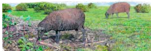
Betande får på overdrev ved Søndersø, akvarell, 2012