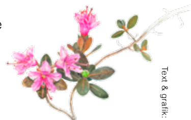
Lapsk alpros (Rhododendron lapponicum), akvarell, 2012

Iliniusiorfik Undervisningsmiddel forlag har nyligen utgett ett plakat "Grønlandske blomster" med 37 arter grönländska blommor, som Carl Christian har illustrerat. Detta uppdrag gav Carl Christian tillfälle att åter sätta sig in i Grönlands flora. I år 1995 illustrerade han boken "Grønlands Natur" för Gads Forlag, som i många år har varit ett av de danska standardverken om ämnet.